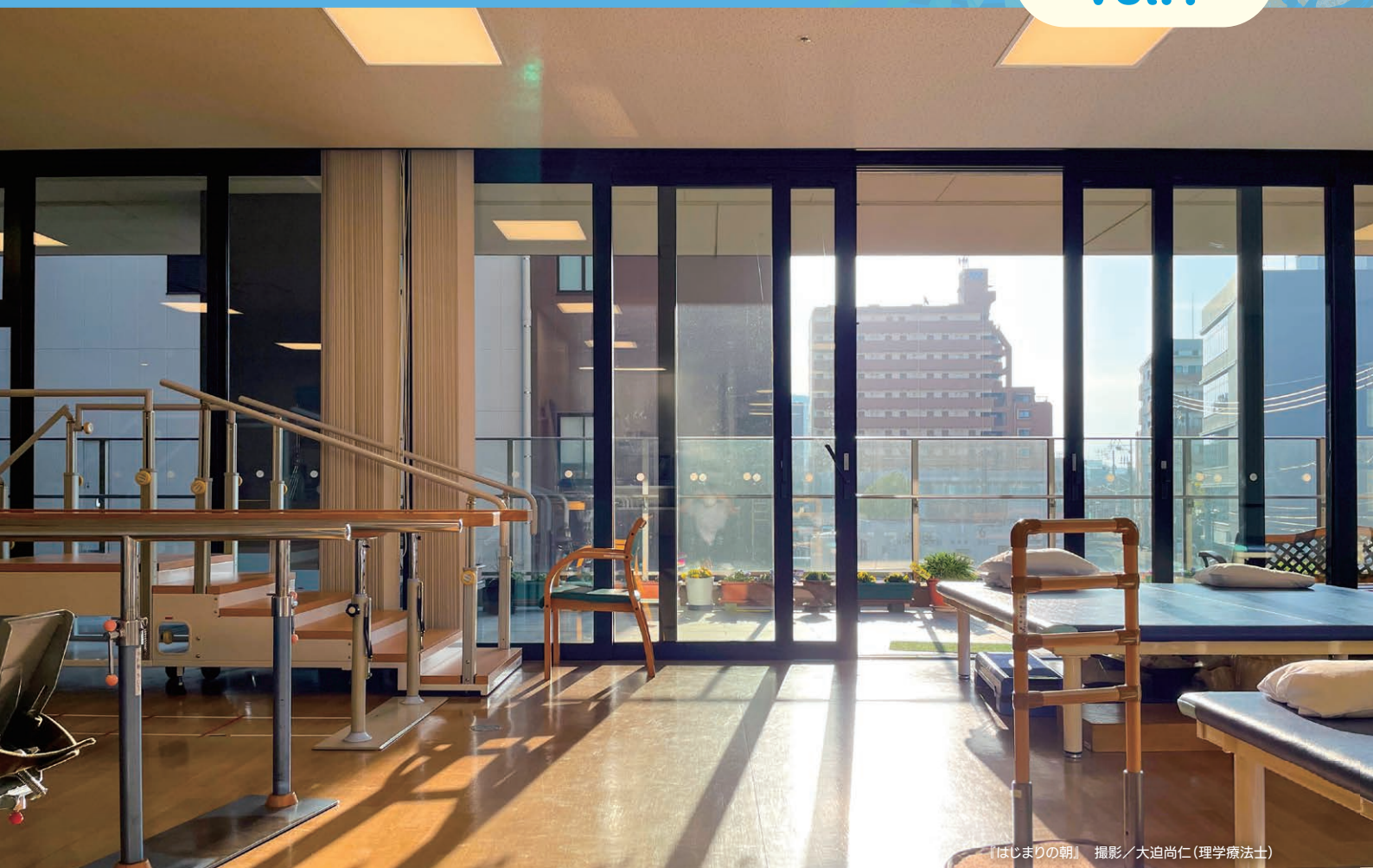
「はじまりの朝」