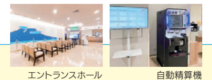
エントランスホール

各種予防接種・健康診断・人間ドックも行っていますので、まずはお気軽にご来院ください。